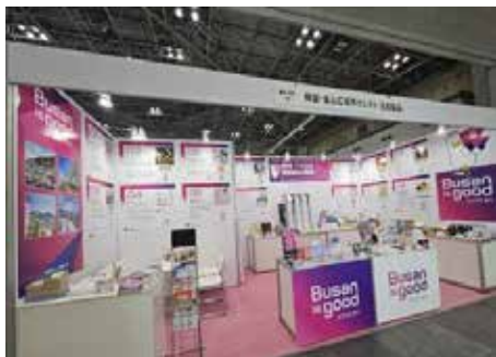
[2025년 부산시 운영부스 전경]

지원목적 | 일본 최대규모 생활잡화 전시회 "도쿄 인터내셔널 기프트쇼" 참가지원 지원규모 | 10개사 내외 ※ 선정 상황에 따라 지원 기업 수는 변경될 수 있음 지원품목 | 화장품, 뷰티 분야 (스킨케어, 메이크업, 헤어·바디케어, 기능성 뷰티 제품, 이너뷰티, 클린뷰티 등) 지원내용 | 선정기업이 제공한 기업 제품(샘플)을 활용한 현지 홍보 진행 ※ 기업의 현장 직접참가 및 직접 홍보는 지원대상 아님 신청기간 | 2026년 4월 27일 (월) ~ 5월 18일 (월) 신청방법 | 홈페이지(https://busan-jp.or.kr) 신청서 다운로드 → 신청서 작성 후 메일(busan@work.odn.ne.jp) 제출 관련문의 | 주일본부산시무역사무소 ☎ 070-5043-7883 / 메일 busan@work.odn.ne.jp