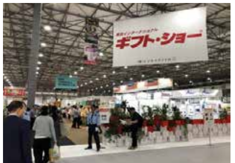
[2025년 행사장 전경]